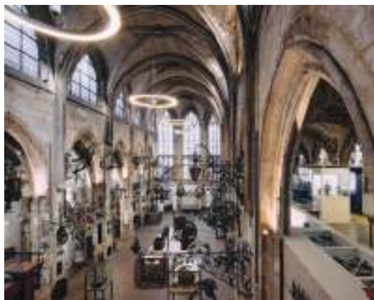
Musée Le Secq des Tournelles