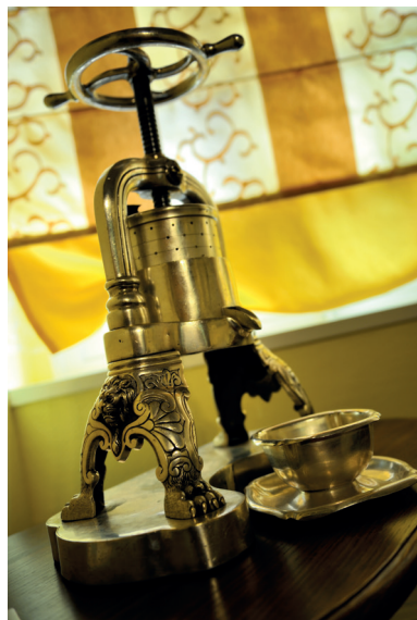
Presse à canard

Après avoir été moutardés, rôtis et grillés, les filets, pattes et ailerons du canard seront levés afin d'extraire les sucres essentiels de la carcasse à l'aide d'une presse à canard en argent, fabriquée chez Christofle , à Yainville, dans la métropole rouennaise. Nappé de sa sauce « rouennaise » (fond sauce à base de vin de bordeaux et d'échalotes) puis flambé, votre caneton vous sera servi avec un flan de céleri et une pomme caramélisée cuite au four. Appelé plus communément « canard au sang », la particularité de cette recette est la cuisson rosée du caneton.