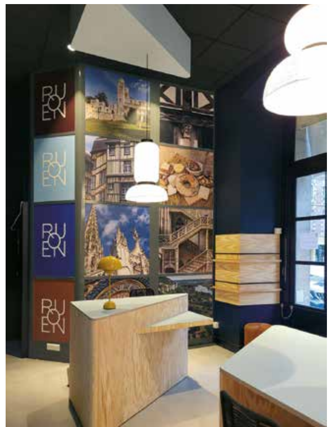
Office de Tourisme de Rouen

Depuis septembre 2022, les conseillers de séjour accueillent les visiteurs dans un nouvel espace situé sur l'esplanade Marcel Duchamp au sein même du bâtiment du Musée des Beaux-Arts. Les travaux de rénovation du Bureau des Finances ont commencé dès le début du mois d'octobre, l'objectif étant d'être prêt pour accueillir les prochains visiteurs de l'Armada en juin prochain.