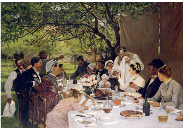
Albert Fourié, Le repas de mariage à Yport , 1886