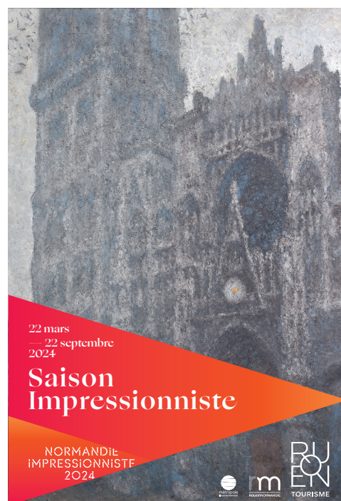
Claude Monet, La Cathédrale de Rouen, Le portail et la tour d'Albane, temps gris (détail), 1893 - 94.

Dans cette seule ville classée Ville créative de l'UNESCO en gastronomie, découvrez l'alliance entre tradition et innovation. Les producteurs locaux, les chefs et les artisans de bouche offrent une expérience gastronomique riche en partage et en générosité. Laissez-vous envoûter par un déjeuner impressionnant au bord de la Seine ou par l'ambiance conviviale de la Fête du Ventre et de la gastronomie.»