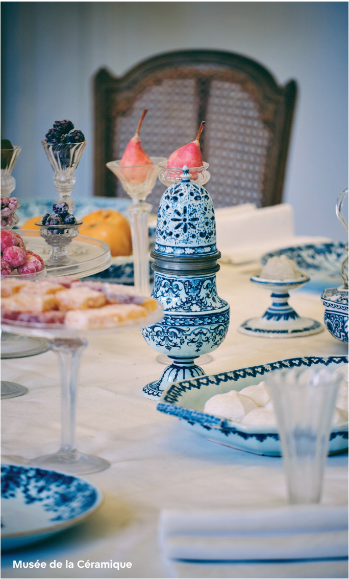
Musée de la Céramique