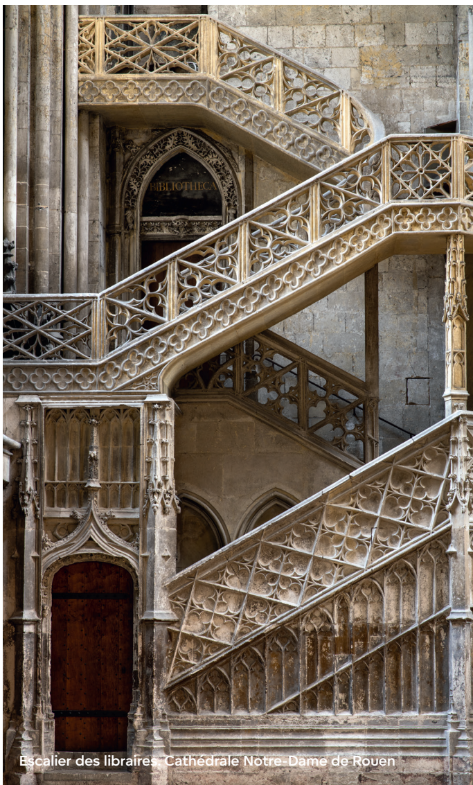
Escalier des libraires - Cathédrale Notre-Dame de Rouen

Mais la Seconde Guerre mondiale meurtrit le territoire. La reconstruction voit se dresser l'audacieuse Tour des archives 41 . En 1976, lors de la restauration du Palais de Justice, est découverte la Maison Sublime 5 , plus ancien monument juif de France, qui viendra finaliser cette cicatrisation. La Métropole est classée Ville et Pays d'art et d'histoire pour la sauvegarde de ses bâtiments remarquables du XI e siècle à nos jours.