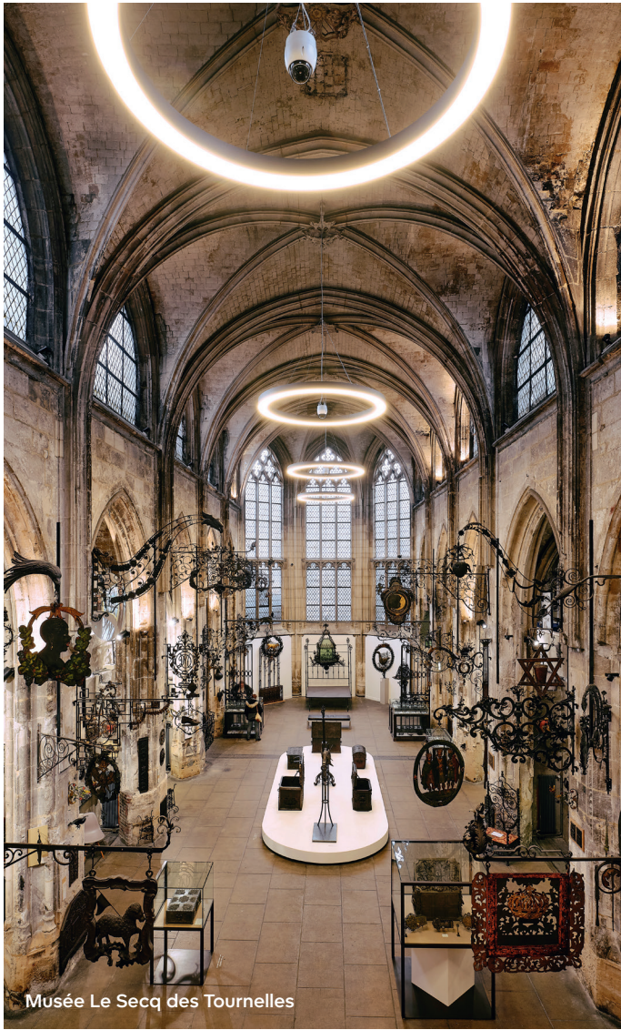
Musée Le Secq des Tournelles

Situé en zone maritime, à proximité du centre, au bassin Saint-Gervais, le port de plaisance et d'hivernage de la Métropole offre tous les services et le confort nécessaires aux plaisanciers. rouenportdeplaisance.fr