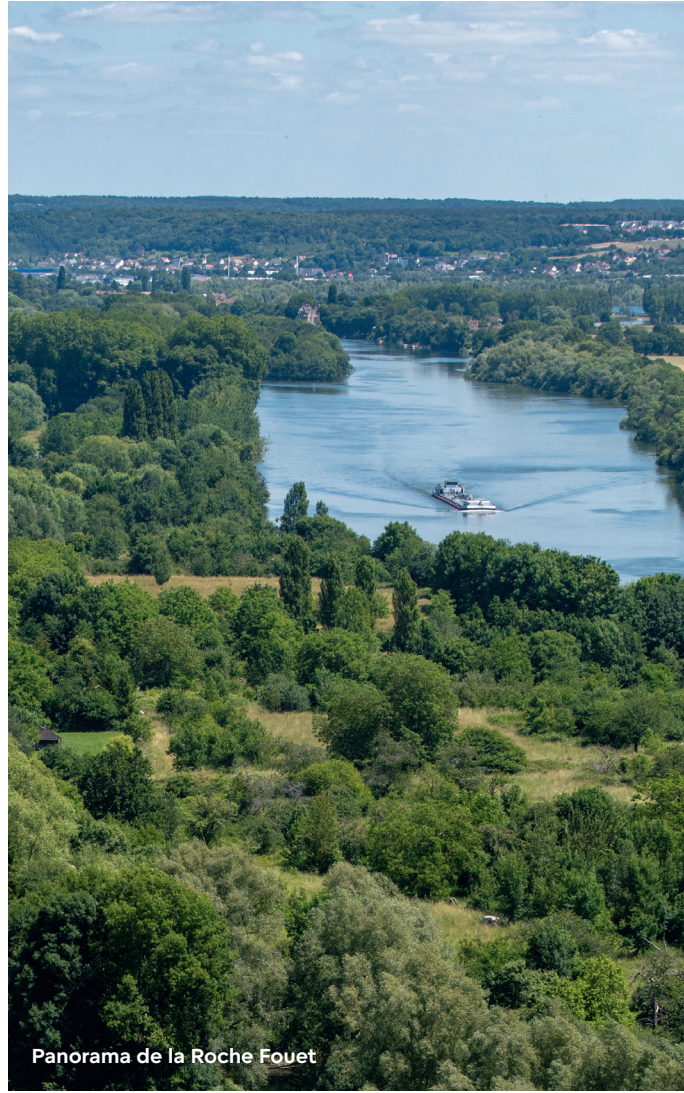
Panorama de la Roche Fouet

À Duclair et à Barneville-sur-Seine 38 , plusieurs points de vue dévoilent la Route des fruits, Jumèges et ses environs, qui disposent d'une base de loisirs et d'une zone de baignade. Au sud de la Capitale normande, c'est la base de loisirs de Bédanne qui ravit les passionnés de sports nautiques.