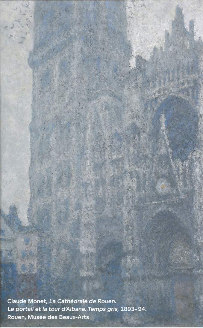
Claude Monet, La Cathédrale de Rouen. Le portail et la tour d'Albane. Temps gris, 1893-94. Rouen, Musée des Beaux-Arts

Les amoureux de ferronnerie trouveront au Musée Le Secq des Tournelles 15 la plus grande collection au monde et les nostalgiques de l'école seront tentés par le Musée de l'Éducation 19 . L'artisanat et la céramique sont présentés dans les pépites du quartier des Antiquaires et à l'Altire Saint-Maclou 4 qui héberge la galerie des Arts du feu. Dans la campagne alentour, une route sacrée mène de l'abbaye Saint-Georges-de-Boscherville 13 à celle de Jumèges 12 , joyaux de l'art roman.