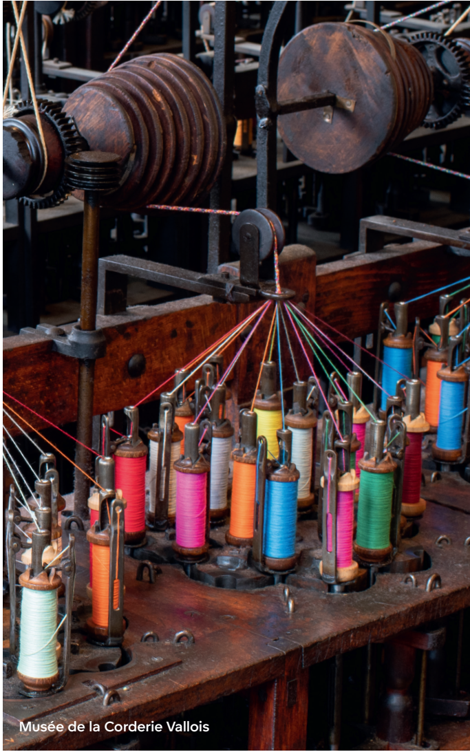
Musée de la Corderie Vallois

Le secteur de la science, les découvertes scientifiques, techniques et industrielles en Normandie sont mises en lumière à l'Atrium 34 .