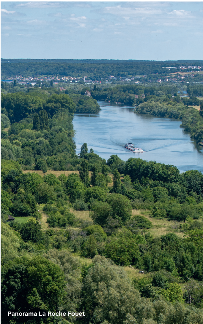
Panorama La Roche Fouet

En Duclair y en Barneville-sur-Seine 38 , varios miradores desvelan la Ruta de las frutas, Jumièges y sus alrededores, que disponen de una base de ocio y de una zona de baño. En el sur, se encuentra la base de ocio de Bédanne que acoge a los apasionados de deportes náuticos.