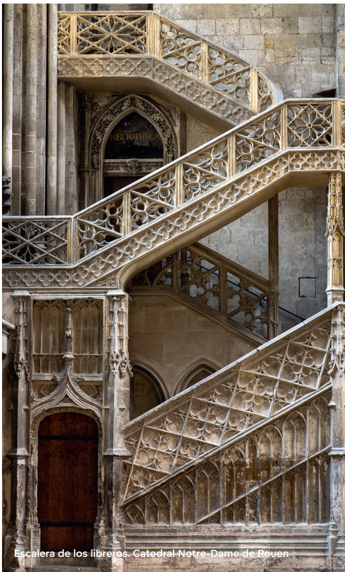
Escalera de los libreros. Catedral-Notre-Dame de Rouen

Sin embargo, la Segunda guerra mundial daña al territorio. La reconstrucción ve alzarse la Torre de los Archivos 41 en 1976, durante la restauración del Palacio de Justicia, se descubre la Maison Sublime 5 , el monumento judío más antiguo de Francia. La ciudad está clasificada como Ciudad y País de Arte e Historia para proteger los edificios excepcionales.